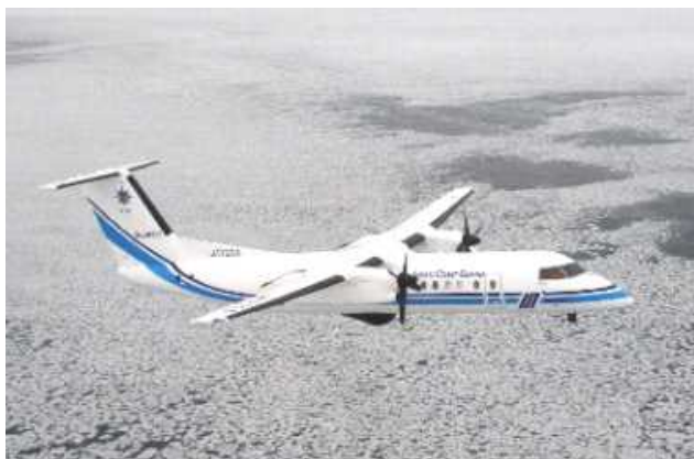
海水観測中の当庁航空機