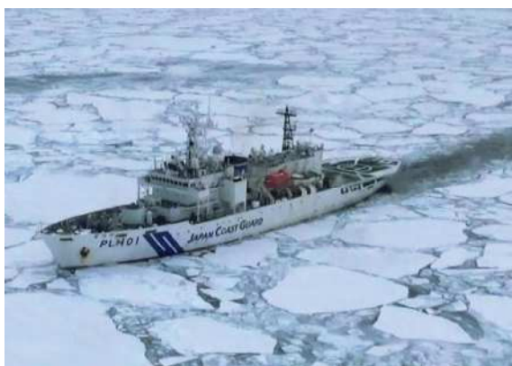
海水観測中の巡視船そうや