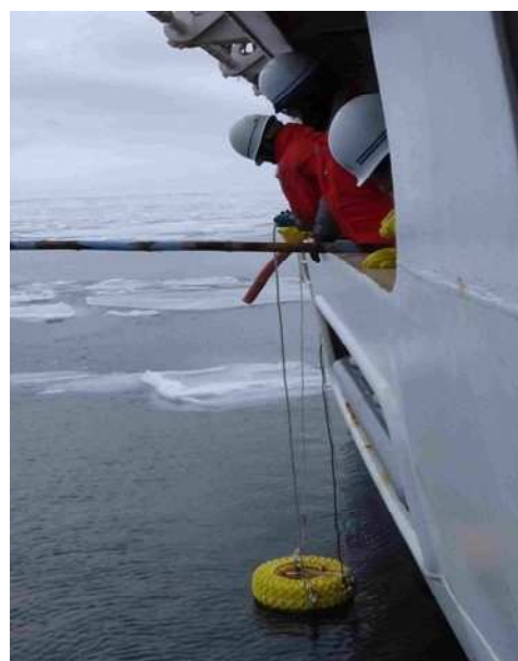
観測機器による調査