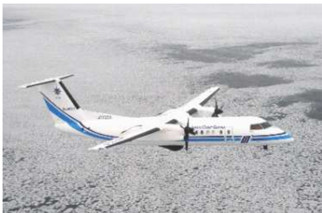
海水観測中の当庁航空機