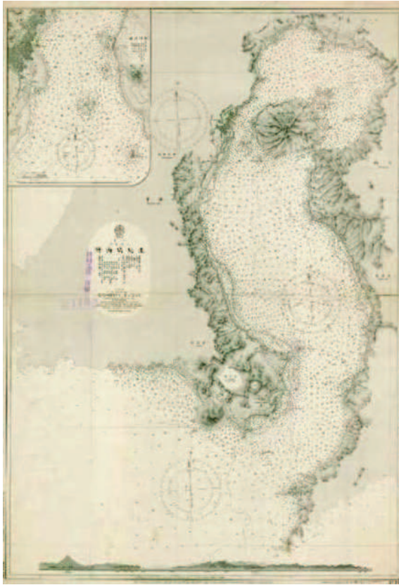
図1 明治32年に刊行した「鹿兒島海灣」の海図