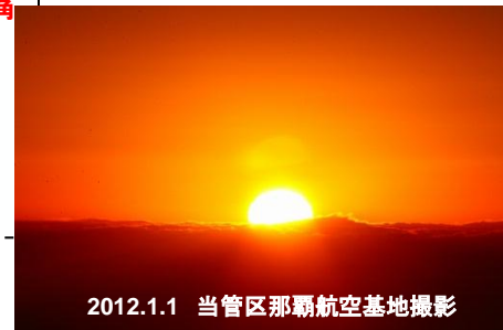
2012.1.1 当管区那覇航空基地撮影