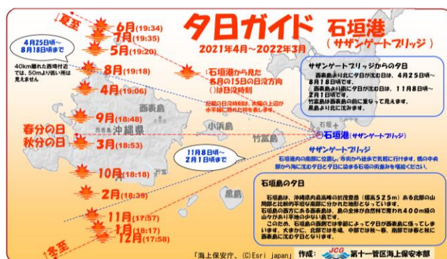
【参考】石垣島サザンゲートブリッジの図

この暦には太陽や月の出没時間の情報等も掲載されており、これらのデータを利用して「夕日ガイド」を作成しました。