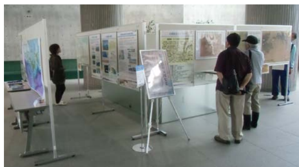
昨年度開催の様子