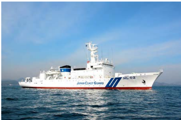
測量船拓洋(船型番号HLO2)