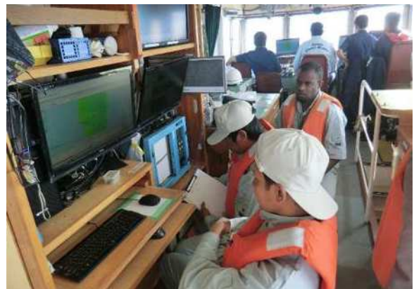
当庁測量船による測深 （十管区所属測量船「いそしお」）