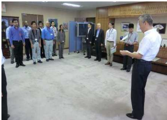
十管区本部長表敬