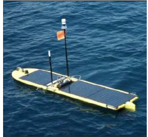
観測中の AOV (海面上)