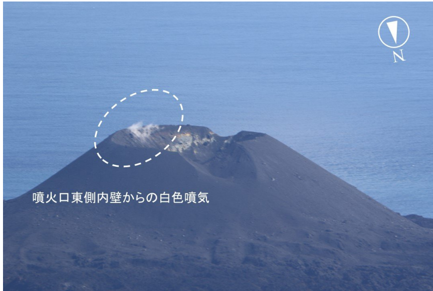
図2 火砕丘中央の噴火口東側内壁からの白色噴気（9月13日撮影）