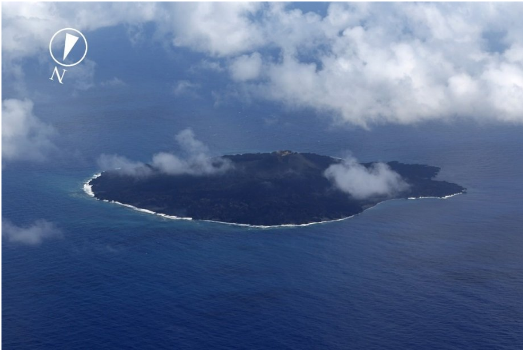
図1 西之島全景（10月7日撮影）