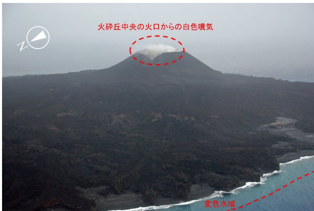
図1 西之島遠景（11月14日撮影）