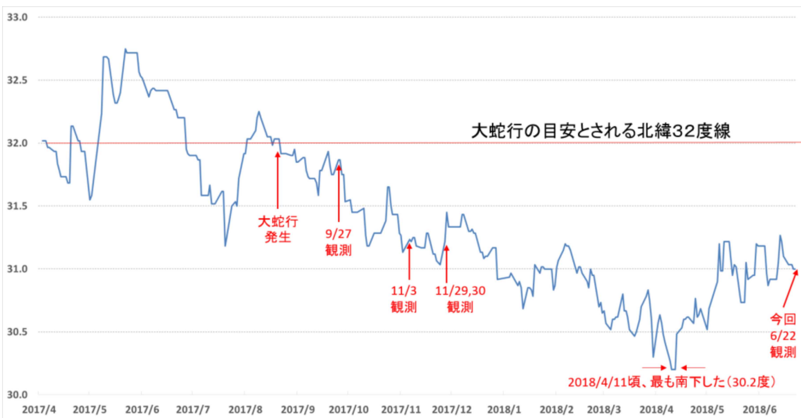
図2 海洋速報による黒潮大蛇行域における流軸の最南端位置の変化