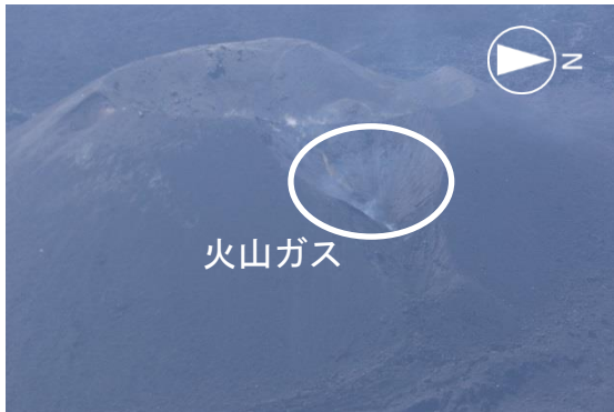
図1 火山ガスが放出されている様子

「二酸化硫黄（SO 2 ）を含む高温の火山ガスの放出が継続しており、活動が活発化している時期に顕著に濃くなる北西部の変色水域が、現在も広い範囲に分布している。このことから、現在は噴火も溶岩流出も停止しているが、噴火が近い将来に再開する可能性が高いと考えられる。」