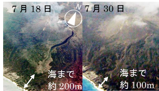
図4 7月18日観測の溶岩流との海までの距離の比較