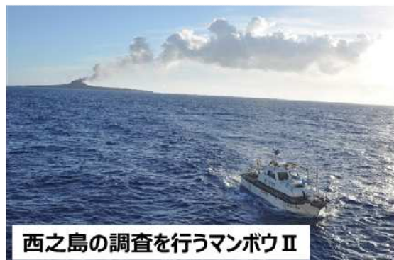
西之島の調査を行うマンボウII