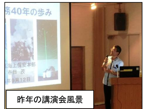
昨年の講演会風景