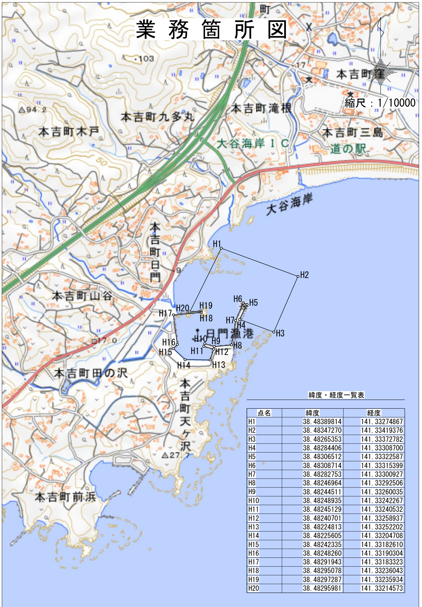
緯度・経度一覧表