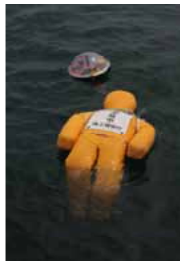
漂流人形にオープンブイ を取り付けた漂流 経路の検証