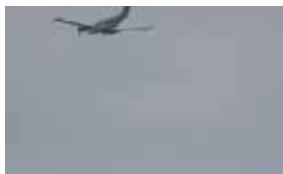
航空機による投下ブイ による漂流経路の検証