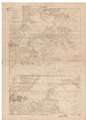
海図第64号「監竈港附近、監竈港」 昭和14年(1939年)

今回の展示では昭和初期に焦点を当て、発展途上にある港湾や、当時は限られた者しか目にすることがなかった、貴重な軍事機密の海図等を見ることが出来ます。