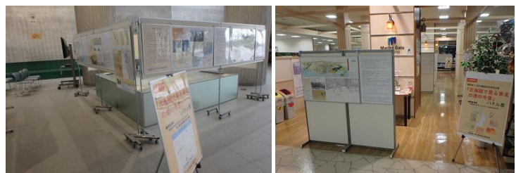
パネル展のイメージ