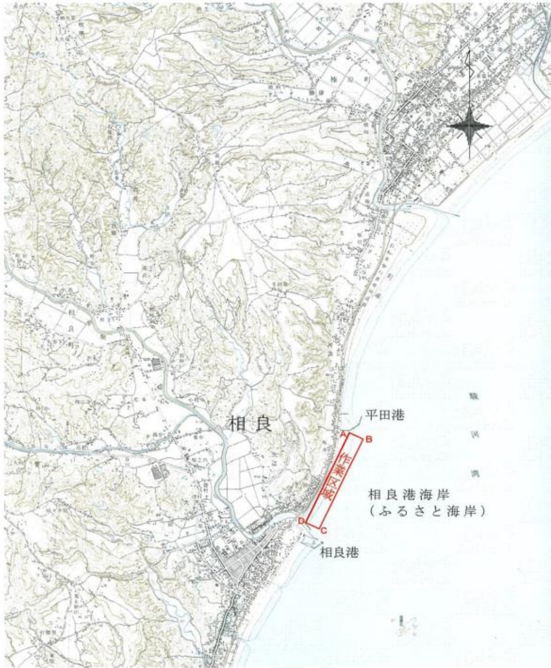
作業区域 (世界測地系)