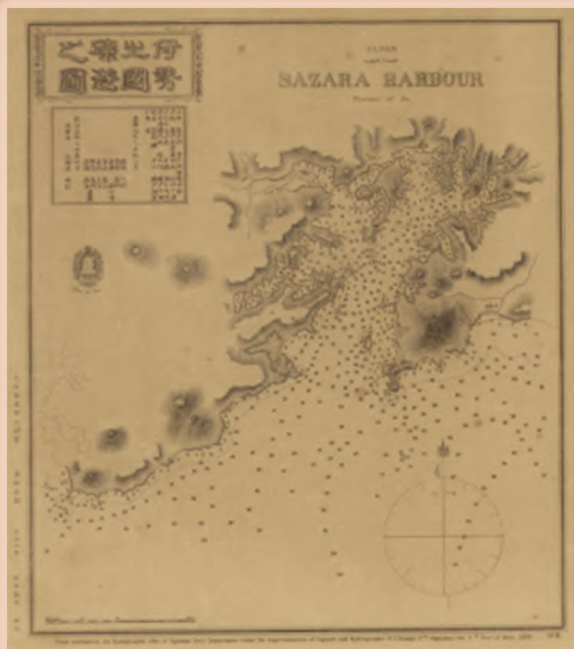
伊勢之國礮港之圖 明治6年刊行