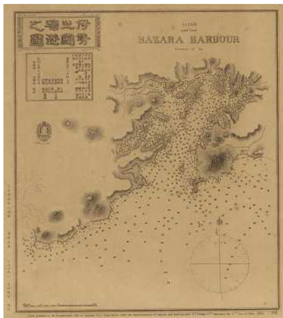
「伊勢之國磯(さざら)港之図」

わが国における近代的な海図の第1号は、明治5年9月(旧暦8月)に完成した「陸中国釜石港之図」です。