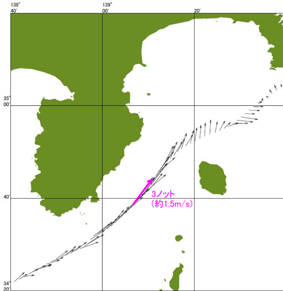
伊豆半島東方の強い流れを観測(11月28日)