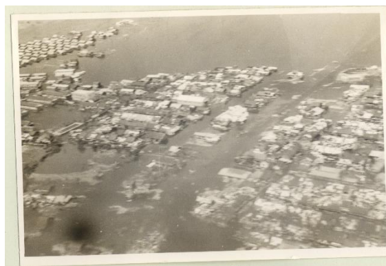
高潮に襲われて水没した港区一帯