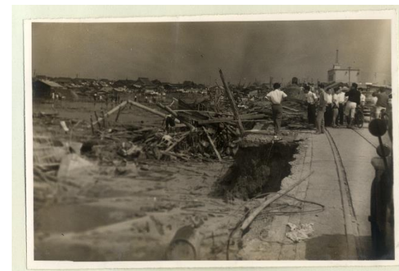
高潮にあらわれた市電路線