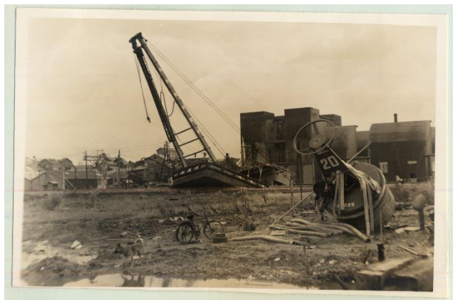
名古屋海上保安部浮標基地付近の様子