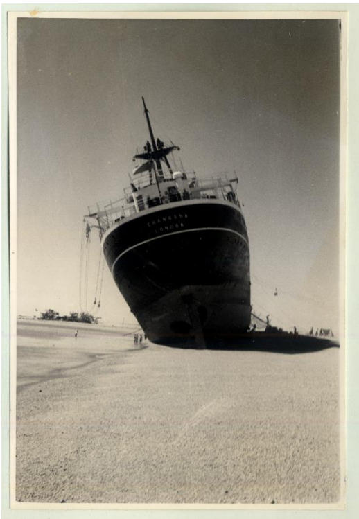
伊勢湾磯津沖に乗揚げた船舶 (7,411トン)