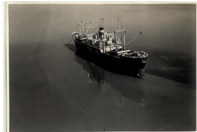
名古屋港西防波堤灯台南西5海里付 近に座礁した船舶(4,690トン)