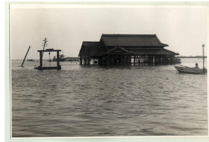
愛知県筏川付近の水没した様子