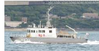
測量船はやしお 平成11年3月竣工 総トン数:27トン 全長:21.0m

船内及び棧橋上は狭く、棧橋には旅客船が発着し一般の方々も利用されるものです。そのため、事前に取材時間を調整させていただきますので、取材を希望される方は、別添「取材申込書(はやしお)」に必要事項をご記入の上、9月13日(金)午後3時まで第七管区海上保安本部広報・地域連携室(電話:093-321-2931(内線2117、2118)、FAX:093-321-6038)まで連絡をお願いします。