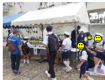
業務紹介、パンフレット配布等 (平成30年度実施)