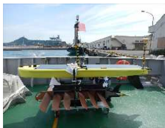
自律型海洋観測装置(AOV)

測量船はやしおの一般公開を実施する棧橋前のウッドデッキ(西海岸3号緑地)において、最新の観測機器である自律型海洋観測装置(AOV)の実物展示を行うほか、海上保安庁の業務紹介や海上保安大学校等の入学案内等に関する展示、パンフレット配布等を行います。