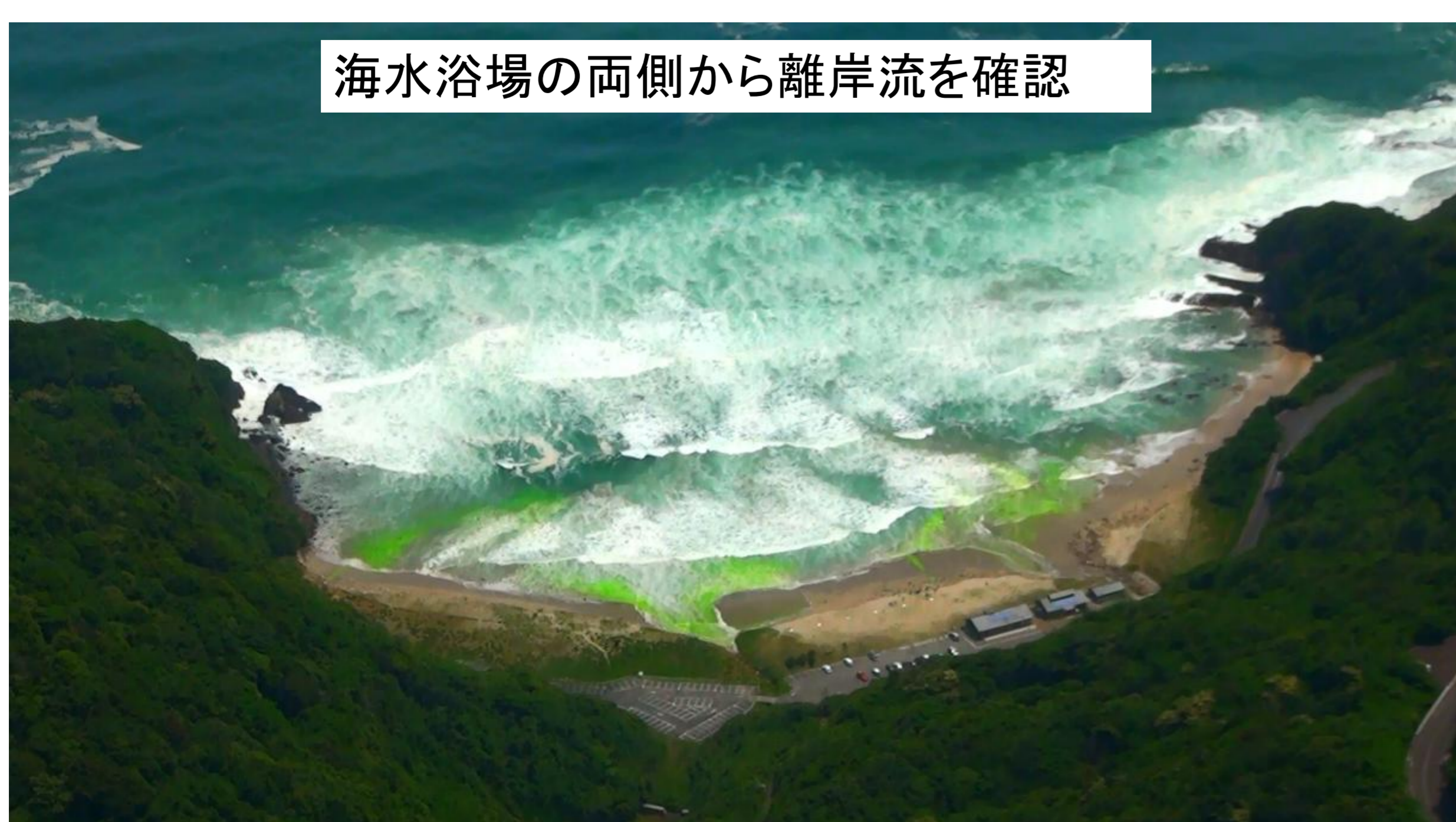
令和元年6月 山口県二位ノ浜海水浴場

岸から流した海面着色剤（黄緑色）が沖へ向かって筋状に流れて行く様子が見られます。