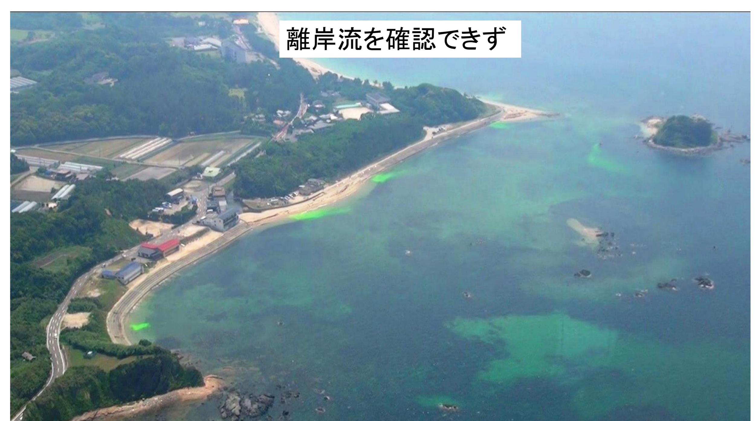
令和元年6月 福岡県勝馬海水浴場