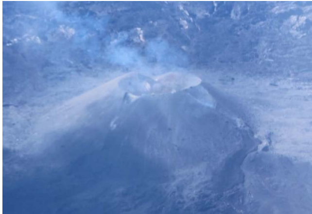
火砕丘の東側に溶岩流が約200m流出している。