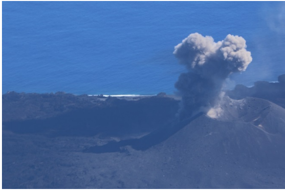
火砕丘東側斜面から噴煙が噴出している。