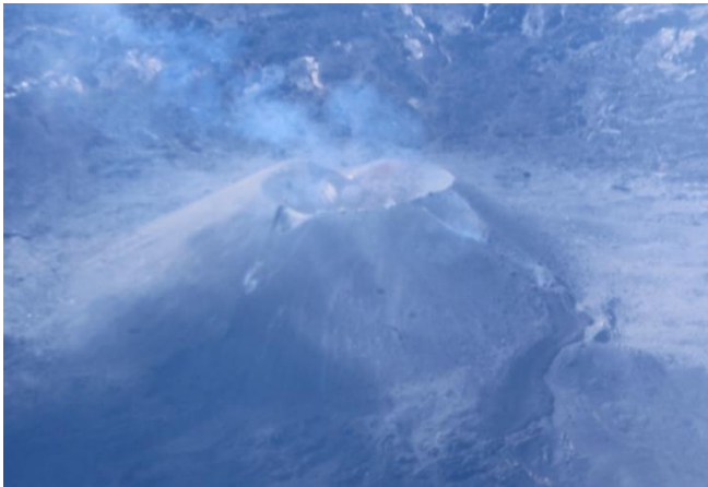
火砕丘の東側に溶岩流が約200m流出している。