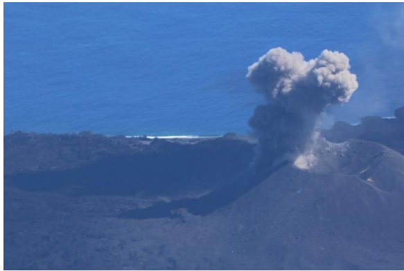
火砕丘東側斜面から噴煙が噴出している。