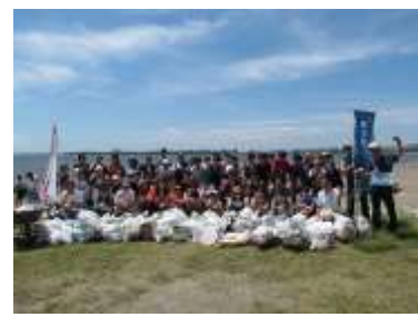
環境啓発活動 (ビーチクリーンアップ)