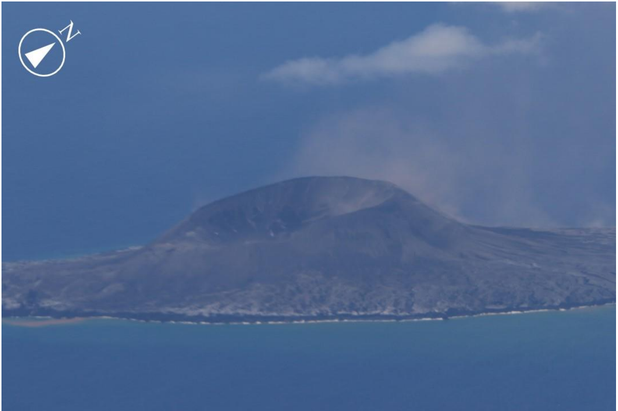
図1 西之島 全景 (2021年8月15日 13:59撮影)