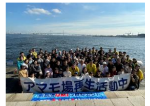
東京湾UMIプロジェクト