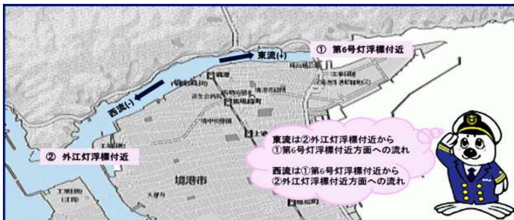
「境水道潮流情報」 説明図